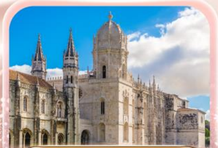
มหาวิหารเจอรูนิโม