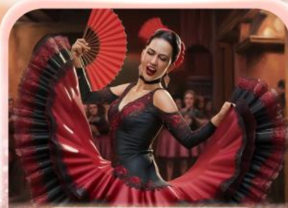
ระบำฟลามิงโก