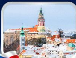
เมืองเซสกี คุลมลอฟ