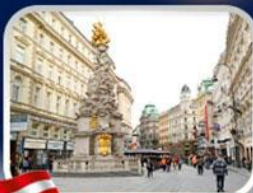
ซ็อบบิงการ์ทเนอร์สตรีก