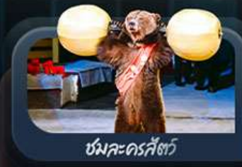
ชมละครสัตว์

highlight สองเมืองไฮไลท์ของรัสเซียที่ไม่ควรพลาด! ตื่นตาตื่นใจกับมหาวิหารเซนต์บาซิล ชมความยิ่งใหญ่ของจัตุรัสแดง สัมผัสอดีตที่พระราชวังเครมลิน ชมความงามของสถานีรถไฟใต้ดินมอสโก ชาร์กอรัส โบสถ์ไอสิกรีนดี เป็นเขาสเปร์โรว์ให้คุณได้สัมผัส ชมความงามพระราชวังฤดูหนาว พิพิธภัณฑ์ฮอร์มิงทง ป้อมปีเตอร์แอนด์ปอล และมหาวิหารเซนต์ไอแซค