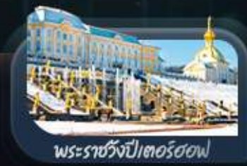
พระราชวังปีเตอร์ฮอฟ