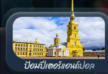
ป้อมปีเตอร์แอนด์ปอล