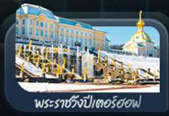
พระราชวังปีเตอร์ฮอฟ