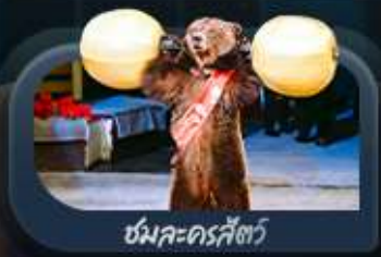
ชมละครสัตว์