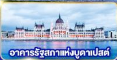
อาคารรัฐสภาแห่งบูดาเปสต์