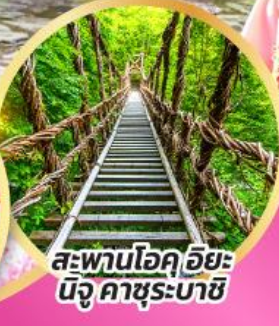
สะพานโอคุอียะ นิจู คาซุระบาชิ