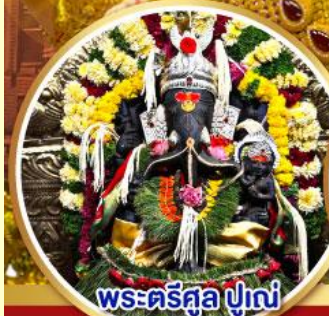
พระศรีศูล ปูเณ (Trishul Pune)