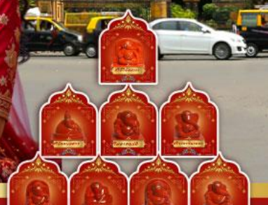
พระพิฆเนศ 8 องค์ เมืองปูเณ