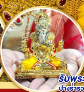
รับพระพิฆเนศปางรำรอย ท่านละ 1 องค์