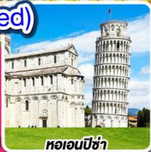
หออนปิซ่า