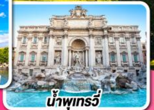
น้ำพุทรวี่