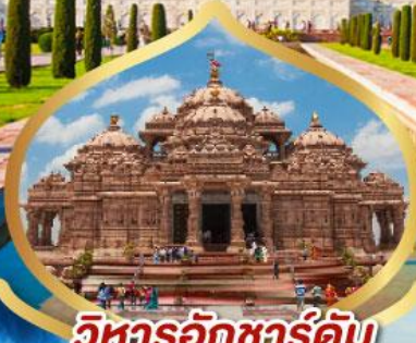
วิหารอักขารัติม