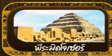
พีระมิดโจซอร์