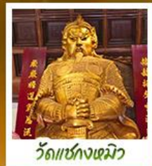
วัดเข่งงหมิว