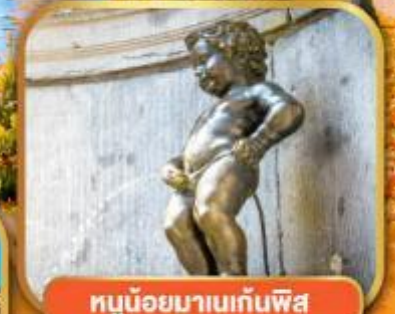
ทูน้อยมาบเทินพีส