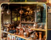
เลือกรื้อของฝากงานหัตถกรรมพื้นเมือง

สัมผัสเสน่ห์แห่งอดีตในเมืองที่เวลาเดินช้าลง กับสถาปัตยกรรมอันงดงาม วัฒนธรรมที่ยังคงมีชีวิต และความอบอุ่นจากผู้คน