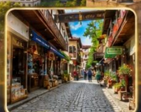
เดินเล่นย่านเมืองเก่าบรรยากาศย้อนยุค