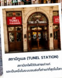
สถานีทูเนล (TUNEL STATION) สถานีรถไฟใต้ดินสายเก่าแก่ และเป็นหนึ่งในระบบขนส่งที่เก่าแก่ที่สุดในโลก