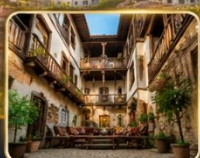
บ้านเรือนสไตล์ออตโตมัน อายุกว่า 200 ปี

เมืองท่องเที่ยวที่มีชื่อเสียงของจังหวัดการาบิก (Karabük) ในปี 1994 เมืองซาฟรานโบลู ได้ถูกองค์การยูเนสโกยกให้เป็นมรดกโลกทางด้านวัฒนธรรม