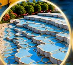
ปานุกคาล์ Pamukkale