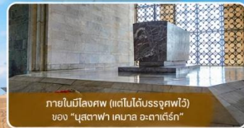
ภายในโถงศพ (แต่ไม่ได้รับอนุญาต) ของ "มุสตาฟา เคมาล อะตาเติร์ก"