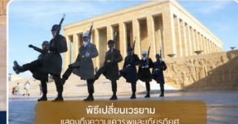
พิธีเปลี่ยนเวรยาม แสดงถึงความเคารพและเกียรติยศ

สถานที่สำคัญที่คนตุรกีให้ความเคารพและจดจำผู้นำผู้ยิ่งใหญ่ ที่อุทิศทั้งชีวิตเพื่อชาติ ศาสนา และประชาชน