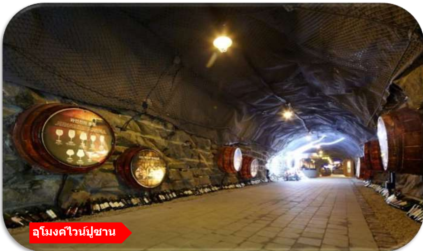
อุโมงค์ไวน์ปูซาน

เยี่ยมชม อุโมงค์ไวน์ปูซาน (Busan Wine Cave) เป็นอุโมงค์ไวน์สุดชิคที่ตกแต่งด้วยแสงสีและงานศิลปะภายในถ้ำ บรรยากาศเย็นสบาย โรแมนติก และเหมาะกับการถ่ายรูปภายในมีโซนชิมไวน์ ผลิตภัณฑ์ท้องถิ่น และมุมจัดแสดงที่ผสมผสานความทันสมัยกับเสน่ห์ของอุโมงค์ใต้ดินได้อย่างลงตัว