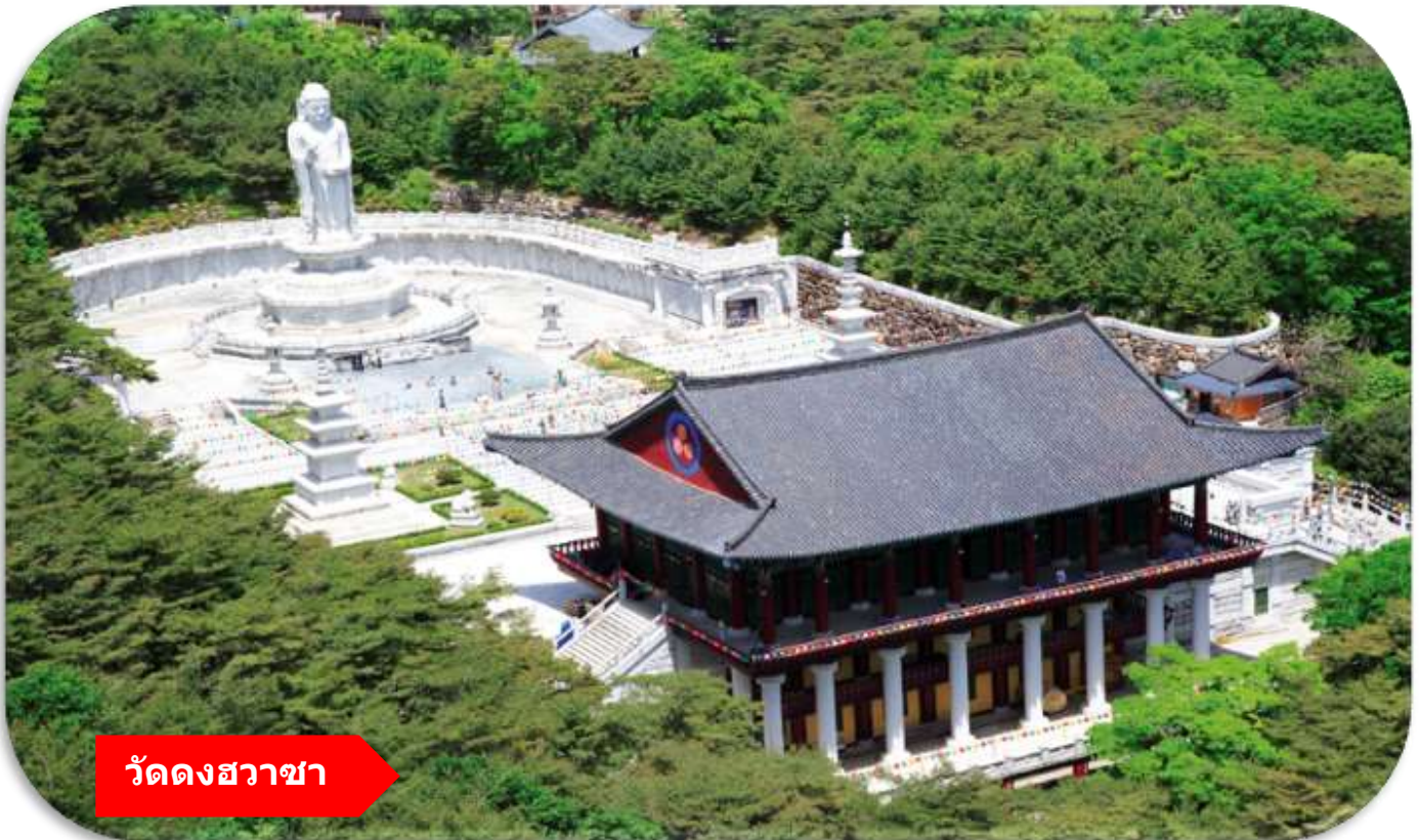
วัดดงฮวาซา

จากนั้น นำท่านเที่ยวชม วัดดงฮวาซา (Donghwas Temple) (รวมกระเช้า พัลกงซานเคเบิลคาร์) เป็นวัดพุทธนิกายโชกเยเก่าแก่กว่า 1,500 ปี ตั้งอยู่บนภูเขาพัลกงซานในเมืองแทกู โดดเด่นด้วยทัศนียภาพธรรมชาติที่สวยงาม ไฮไลท์สำคัญคือ "พระพุทธรูปหินขนาดใหญ่" หรือ พระพุทธรูปหินขนาดใหญ่ยักษ์สูงมากกว่า 30 เมตร สถาปัตยกรรมโบราณและกิจกรรมการพักผ่อนเชิงปฏิบัติธรรม สายมูห้ามพลาด ซึ่งคนเกาหลีนิยมไปสักการะเพื่อขอพรเรื่อง สุขภาพ อายุยืน แคล้วคลาดปลอดภัย ผ่านอุปสรรคต่าง ๆ