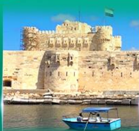
บ่อนประการ Quite Bay