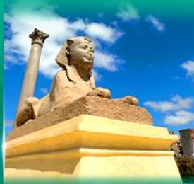
เสาชิงช้า