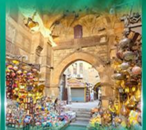
ตลาดท่านอลกาลิ