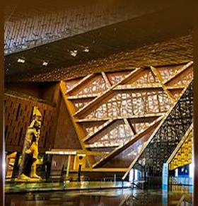
พิพิธภัณฑ์ไทรนด์อียิปต์ (GEM)