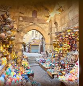
ตลาดงานเวอลาสี