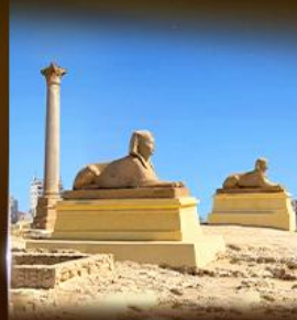
เสาโรบินบองเบย์