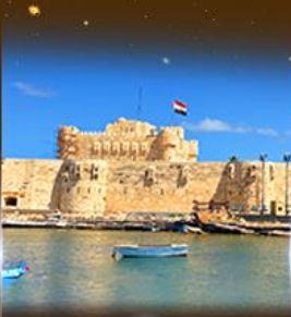
บึงนรากรม Quite Bay