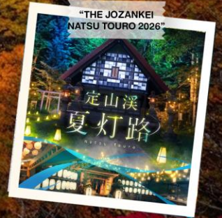
“THE JOZANKEI NATSU TOURO 2026”

วันเดินทาง 23 - 28 ต.ค. 2569 (วันปืยมหาราช) 28 ต.ค. - 2 พ.ย. 2569 30 ต.ค. - 4 พ.ย. 2569