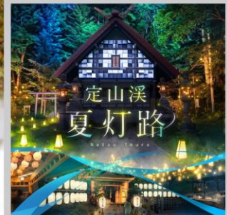
“JOZANKEI NATSU TOURO 2026”