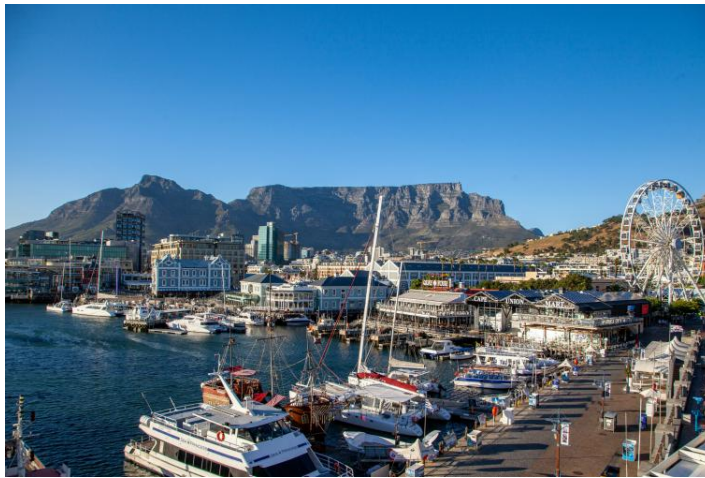
THE VICTORIA AND ALFRED WATERFRONT