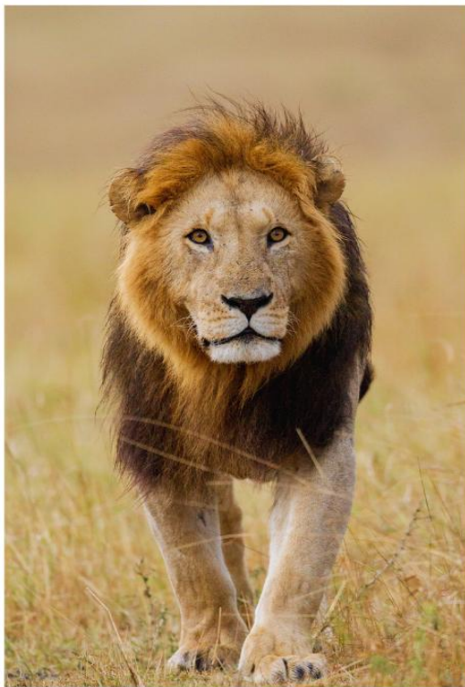
BIG FIVE GAME DRIVE

สัมผัสประสบการณ์สุดตื่นเต้น ชมสัตว์ป่าอย่างใกล้ชิดท่ามกลางธรรมชาติอันอุดมสมบูรณ์ ตื่นตาตื่นใจไปกับ "Big Five" อันเลื่องชื่อ ได้แก่ สิงโต ช้าง แรด ควายป่า และเสือดาว ที่ออกมาใช้ชีวิตอย่างอิสระในถิ่นอาศัยตามธรรมชาติ อีกหนึ่งไฮไลท์ที่ไม่ควรพลาด คือโอกาสในการชมปรากฏการณ์การอพยพของสัตว์ป่าขนาดใหญ่ ซึ่งชวนให้นึกถึงภาพอันยิ่งใหญ่คล้ายของ Maasai Mara National Reserve ที่มีชื่อเสียงระดับโลก