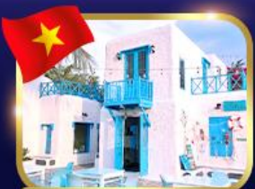
คาเฟ่สไตล์ซานโตรินี่ ชันทรา มารีน่า