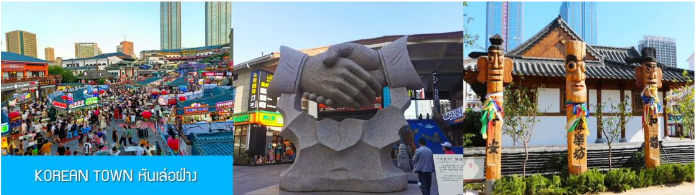
KOREAN TOWN หันเล่อฝาง