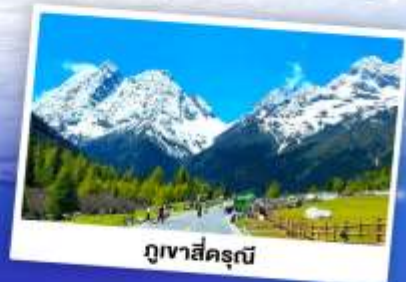
ภูเขาซีครณี