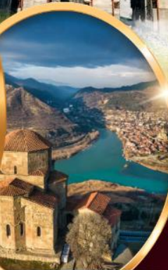
อารามจวารี

ทบิลีซี มิทสเคต้า คาซเบกกี กูดาอูรี กอริ อัฟลิสต์ซิคเคห์ คูไตซี บากูมิ