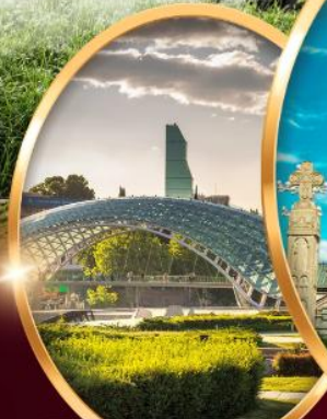
สะพานมิตรภาพ