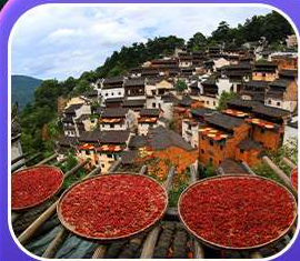
“หมู่บ้านหวงหลิง”

หุบเขาเทวดาวังเซียนกู่ หมู่บ้านที่ตั้งอยู่ริมหน้าผา • หมู่บ้านโบราณหวงหลิง ป่าสนน้ำชิงซาน • ล่องเรือทะเลสาบซีหู • ถนนโบราณตุ๋นจื่อ • ชมแสงสีที่ ฉู่หนีโจว