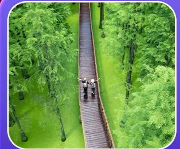
“ป่าสนชิงซาน”

T2G-HGH01GJ Welcome Hangzhou...หงโจว ฉู่โจว ฉู่หยวน ช่างเหรา หุบเขาเทวดา 5D 4N (GJ)