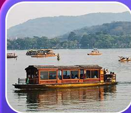
“ล่องเรือทะเลสาบซีหู”