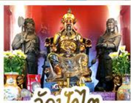
วัดปี้กั๊ต