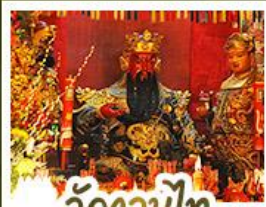
วัดกวนน้้ไท