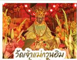
วัดเจ้าแม่กวนอิมอ่องฮ่า