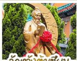
วัดเว้งต้าเซ็งน