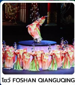
โชว์ FOSHAN QIANGUING