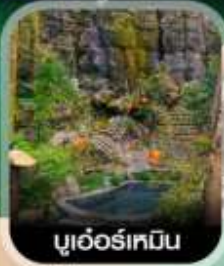
บูเออร์เหมิน