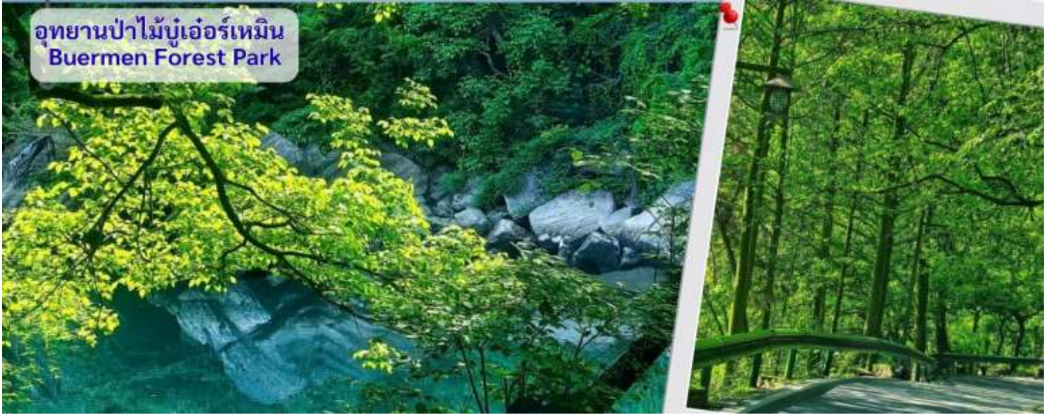
อุทยานป่าไม้บูเออร์เหมิน Buermen Forest Park

จากนั้นนำทุกท่านเดินทางสู่ น้ำพุร้อนบูเออร์เหมิน เป็นน้ำพุร้อนธรรมชาติที่มีชื่อเสียงที่สุดแห่งหนึ่งในมณฑลหูหนาน ตั้งอยู่ทางทิศใต้ของ อุทยานป่าไม้แห่งชาติบูเออร์เหมิน ในอำเภอหยงชุ่น: น้ำในบ่อน้ำพุร้อนอุดมไปด้วย แร่ธาตุสำคัญ สตรอนเชียม ซิลิเกต ซึ่งมีคุณสมบัติช่วยบำรุงผิวพรรณ ช่วยระบบไหลเวียนโลหิต และผ่อนคลายระบบประสาทส่วนกลาง อุดมภูมิน้ำพุร้อน ที่มีอุณหภูมิคงที่ประมาณ 39.8 - 41 องศาเซลเซียส ตลอดทั้งปี ซึ่งเป็นระดับที่พอเหมาะสำหรับการแช่เพื่อสุขภาพ บรรเทาอาการแช่บ่อน้ำพุร้อนตั้งอยู่ท่ามกลางทัศนียภาพที่สวยงามริมแม่น้ำเมิ่งตั้ง โดยมีทั้งบ่อกลางแจ้งที่สร้างขนานไปกับหน้าผาและซ่อนตัวอยู่ในป่าทึบ รวมถึงบ่อในร่มและบริการสปา จำนวนบ่อมีบ่อแช่กลางแจ้งให้บริการมากกว่า 29 บ่อ กระจายตัวอยู่ในพื้นที่ป่าไม้ที่อุดมสมบูรณ์ ภายในศูนย์น้ำพุร้อนมีห้องโถงต้อนรับ สถานที่อาบน้ำ ห้องอาบน้ำแบบแผ่นหิน และบ่อแช่ตัวผสมสมุนไพร (ลูกค้าต้องใส่ชุดว่ายน้ำลงเท่านั้นกรรราเตรียมชุดว่ายน้ำไปด้วย)