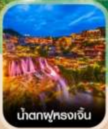
น้ำตกผุ่หลงเจิ้น

สัมผัสสายหมอกแห่งขุนเขา สะพานอ้ายจ้าย แบบพาโรนามา แช่น้ำพุร้อนกลางธรรมชาติ อุทยานป่าไม้บูเออร์เหมิน ชมความอลังการ น้ำตกพันปี หมู่บ้านโบราณผุ่หลงเจิ้น