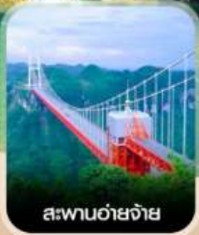
สะพานอ้ายจ้าย