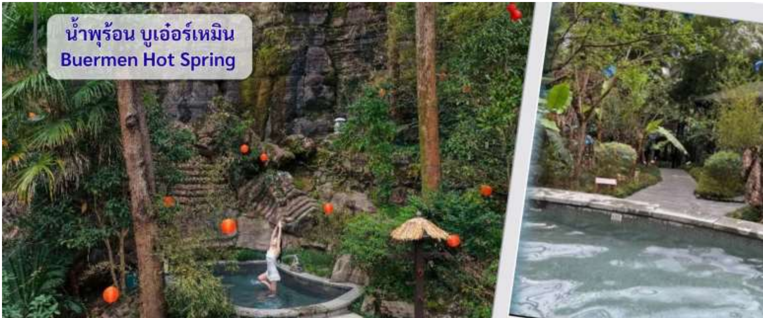
น้ำพุร้อน บูเออร์เหมิน Buermen Hot Spring

ค่า 10 | รับประทานอาหารค่ำ ณ ภัตตาคาร (3)