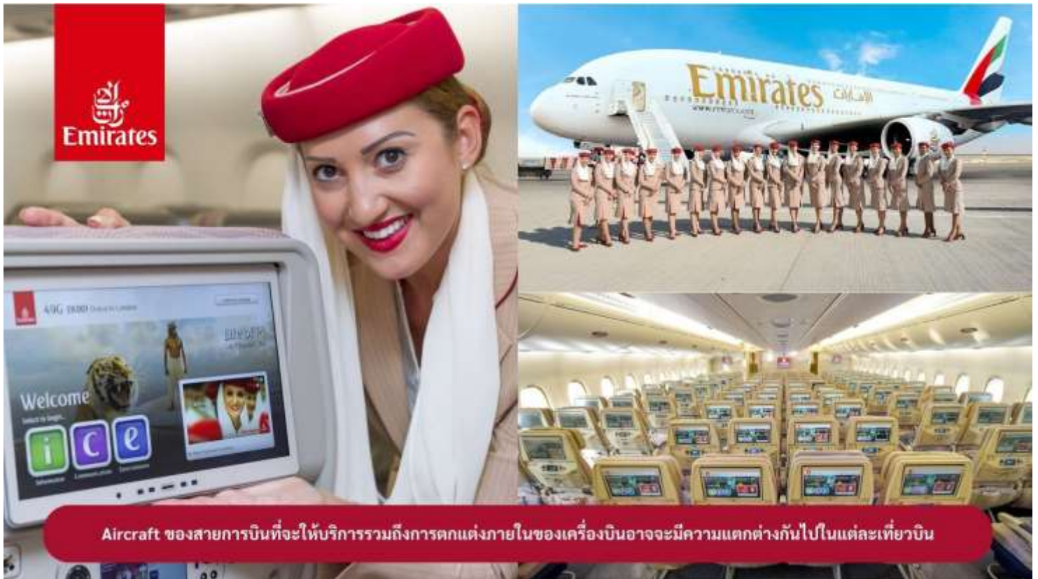
Aircraft ของสายการบินที่จะให้บริการรวมถึงการตกแต่งภายในของเครื่องบินอาจจะมีความแตกต่างกันไปในแต่ละเที่ยวบิน

23.00 น. !!!! คณะเดินทางพร้อมกัน ณ สนามบินสุวรรณภูมิ อาคารผู้โดยสารขาออกระหว่างประเทศ ชั้น 4 ประตู 9 แถว T สายการบินเอมิเรตส์ แอร์ไลน์ (EK) เจ้าหน้าที่ให้การต้อนรับและอำนวยความสะดวก