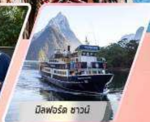
มิสฟอร์ด ซาวนี