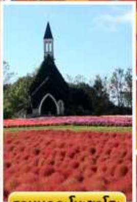
สวนบกกะโนะซาโตะ