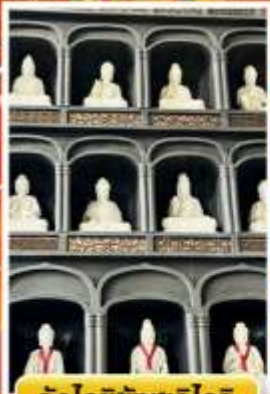
วัดไดชิซังเซอิไดจิ