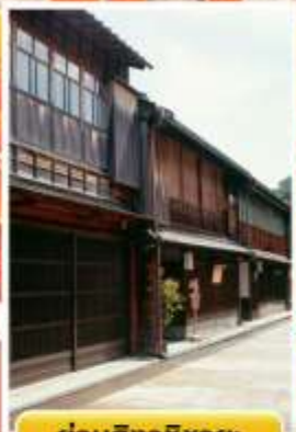
ย่านอิงาชิบายะ