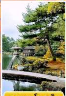
สวนเคนโระคุเอ็น