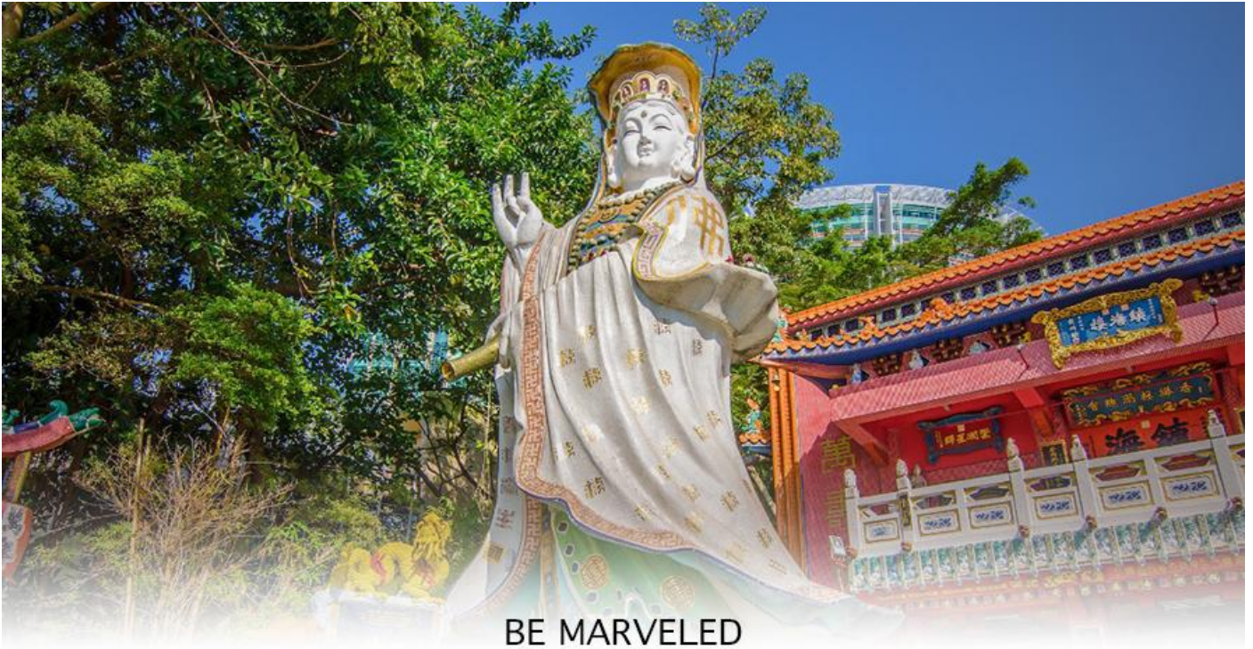
BE MARVELED วัดเจ้าแม่กวนอิมริพลีเบย์