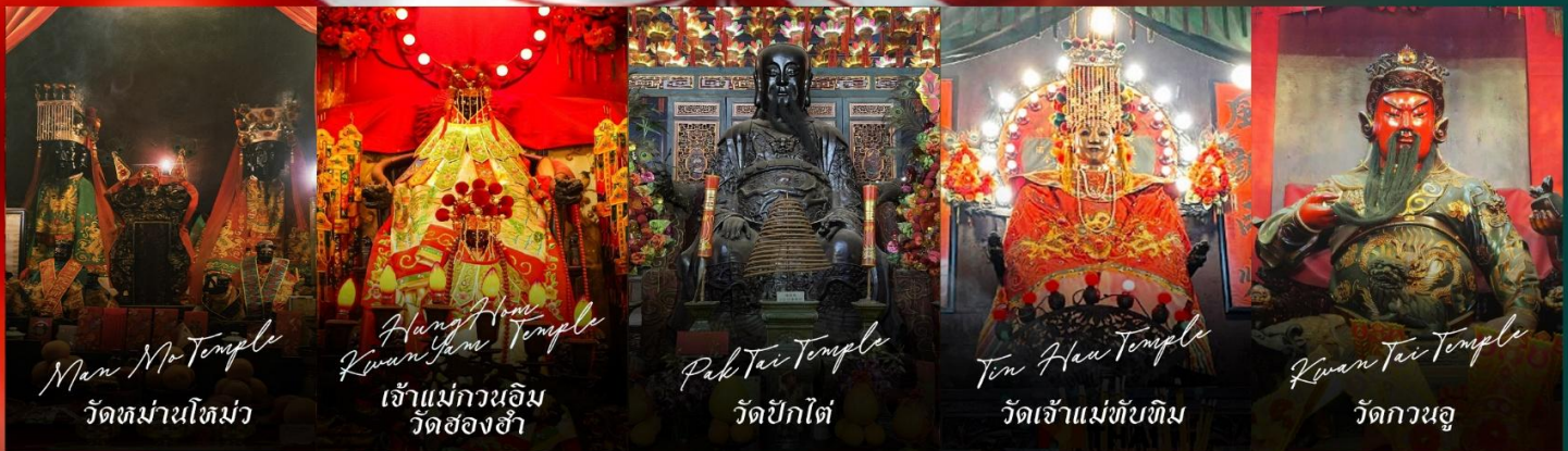
Man Mo Temple วัดหม่ามโทมัว

รายการทัวร์ข้างต้นอาจมีการปรับเปลี่ยนเพื่อความเหมาะสม