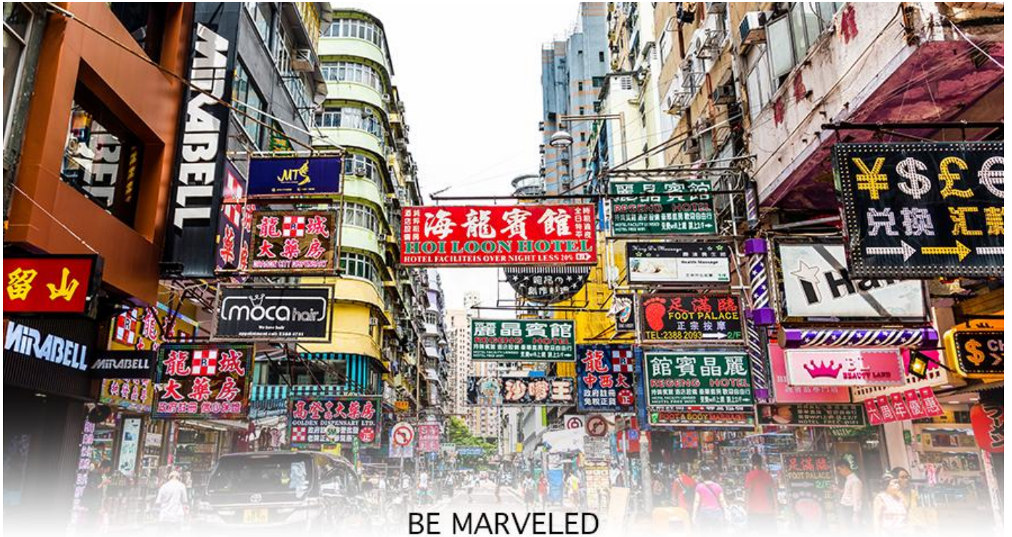
BE MARVELED MONGKOK

จากนั้นนำท่านช้อปปิ้ง ย่านมก๊ก (MONG KOK) เป็นแหล่งช้อปปิ้งที่เต็มไปด้วยตรอกซอกซอยที่มีเอกลักษณ์แปลกตา รวมทั้งตลาดเก่าแก่ที่สะท้อนเสน่ห์และวิถีชีวิตของคนท้องถิ่น ถือเป็นหนึ่งในย่านยอดนิยมที่นักท่องเที่ยวทุกคนต้องแวะเวียนมา ภายในย่านมีตลาดนัด LADIES' MARKET ขนาดใหญ่ซึ่งมีร้านขายเสื้อผ้า เครื่องสำอาง รองเท้า กระเป๋า เครื่องประดับมากมาย อีกทั้งยังมีร้านอาหาร และเครื่องดื่ม ที่ขึ้นชื่อหลากหลายชนิด ให้ทุกท่านได้ลองลิ้มรสอีกมากมาย