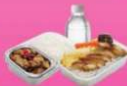
บริการอาหารร้อนบนเครื่อง ซาโป - ซากสับ