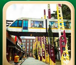
“ตงเจียวจื่อ”