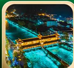
“สะพานหนานเฉียว น้ำคาสีฟ้า”