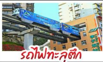
รถไฟทะลุตึก