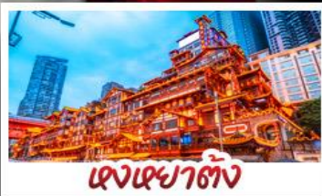
เจงเฉาตัง