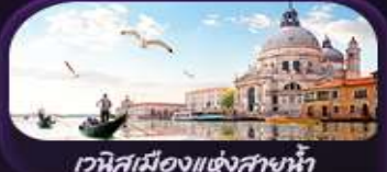
เวนิสเมืองแห่งสายน้ำ

ROME FLORENCE PISA COMO LUCERNE JUNGFRAUJOCH PARIS