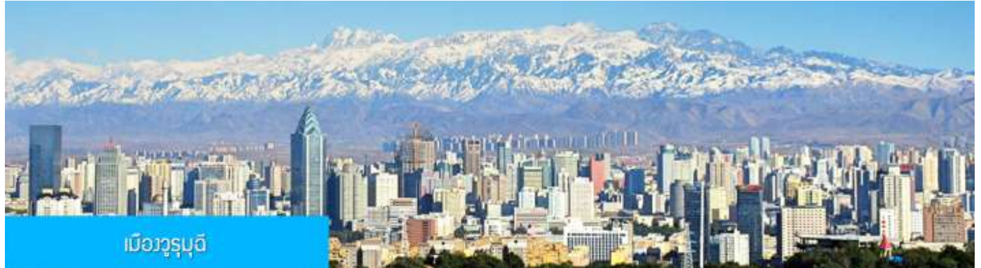
เมืองูรูมูฉี