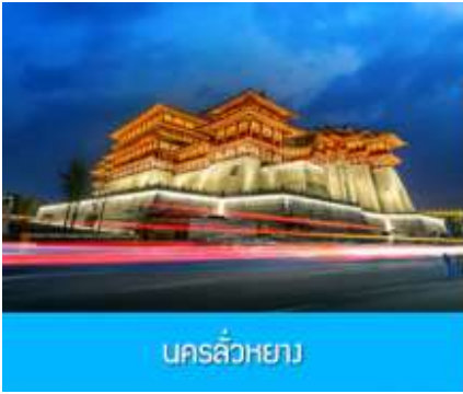
นครฉว๋หยาง