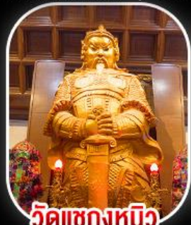
วัดเขกหมิว

วัดเขกหมิว- วัดเจ้าแม่กวนอิมฮ่องกง พระใหญ่ไผ่หลิน + กระเช้าเองปีง เมนูสุดพิเศษ!! ทิมซ่าเองกง บุฟเฟ่ต์ชาบูสไตล์ฮ่องกง และห่านย่าง อิสระท่องเที่ยวดิสนีย์แลนด์ 1 วัน เลือกซื้อบัตรดิสนีย์แลนด์หรือซ้อปีงจุใจ