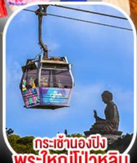
กระเช้าเองปีง พระใหญ่ไผ่หลิน