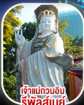
เจ้าแม่กวนอิม รีพัสลีย์