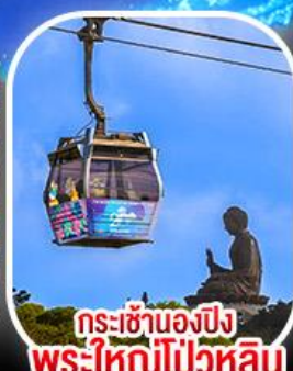
กระเช้าเองปีง พระใหญ่โป่วหลิน