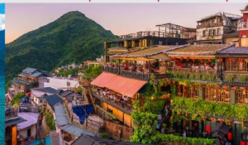
ถนนโบราณจิวเฟิ่น