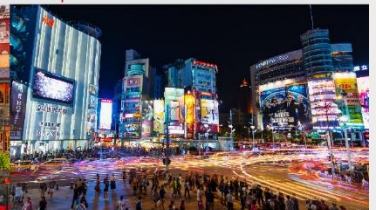
ตลาดกลางคืนซีเหมินตึง

*ทางบริษัทฯ ขอสงวนสิทธิ์ในการสลับโปรแกรมทัวร์ตามความเหมาะสมขึ้นอยู่กับสถานการณ์หน้างาน โดยคำนึงถึงผลประโยชน์ของลูกค้าเป็นสำคัญ