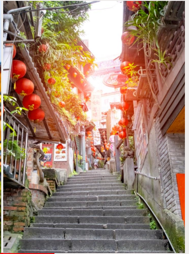
ถนนโบราณจีวเฟิ่น (Jiufen Old Street)