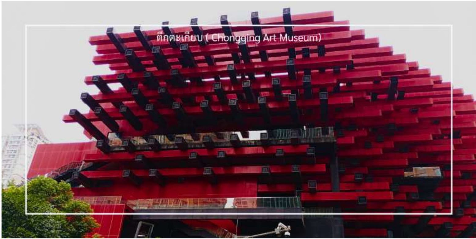
ตึกตะเกียบ ( Chongqing Art Museum)