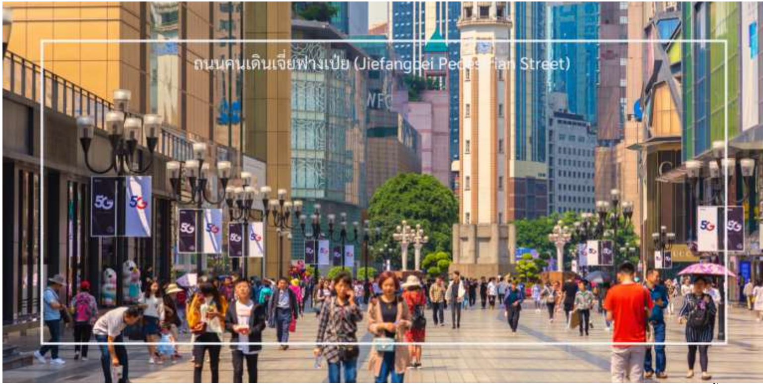
ถนนคนเดินเจียงเป่ย์ (Jiefangbei People's Square Street)

นำท่านสู่ ถนนคนเดิน กวนอินเฉียว (Guanyinqiao) ย่านหัวใจการค้าและแสงสีแห่งมหานครฉงชิ่ง (อิสระ ช้อปปิ้งและอาหารเย็น) สามารถเพลิดเพลินกับการช้อปปิ้งทั้งของฝากและอาหาร ขนม ของว่าง ซิมอาหารพื้นเมือง และเก็บภาพสีสันยามราตรีอันตระการตา ต็มดั่งบรรยากาศสุดทันสมัย ณ ย่านกวนอินเฉียว ศูนย์กลางการช้อปปิ้งและความบันเทิงที่ใหญ่ที่สุดในเขตเจียงเป่ย์ ถนนคนเดินความยาวกว่า 700 เมตรแห่งนี้ เต็มไปด้วยห้างสรรพสินค้าหรู ร้านแฟชั่นระดับโลก และร้านอาหารชื่อดัง ที่พร้อมตอบโจทย์ทุกสไตล์การท่องเที่ยวยามค่ำคืน กวนอินเฉียวจะเปล่งประกายไปด้วยแสงไฟนีออนและจอ LED ขนาดยักษ์ สร้างบรรยากาศคึกคักไม่แพ้มหานครใดในเอเชีย จนได้รับการขนานนามว่า “ชิบูย่าแห่งฉงชิ่ง” นักท่องเที่ยวสามารถเพลิดเพลินกับการช้อปปิ้ง