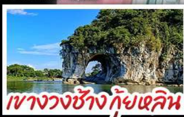
เขางวงช้างกัซเดลิน