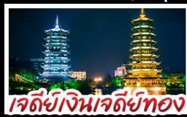
เจดีย์เงินเจดีย์ทอง

ล่องแพไม้ไผ่ แม่น้ำหลี่เจียง - ภูเขาห้วย กระเช้า ไปกลับ บ้านบันไดหลงเซ็น - เจดีย์เงินเจดีย์ทองวิวคำ เขางวงช้าง - บอลลูนชมวิว 360 แม่บุพิศข บุปผ์ตึงย่างบาร์บีคิว ปลาอบเบียร์ เผือกคริสตล สุกี่เห็น