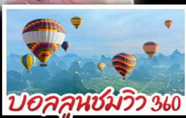
บอลลูนชมวิว 360