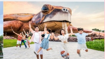
วินเพิร์ล อควาเรียม

*ทางบริษัทฯ ขอสงวนสิทธิ์ในการสลับโปรแกรมทัวร์ตามความเหมาะสมขึ้นอยู่กับสถานการณ์หน้างาน โดยคำนึงถึงผลประโยชน์ของลูกค้าเป็นสำคัญ