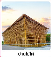
บ้านไม้ไผ่

ไอโလာร์ เทียวครบ สวนน้ำ Aquatopia & สวนสนุก Vin Wonder เวนิสแห่งเวียดนาม Grand World Phu Quoc แลนด์มาร์คสุดโรแมนติก