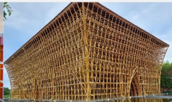
บ้านไม้ไฟ