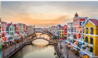
แกรนด์เวิลด์ฟู้ท๊วก