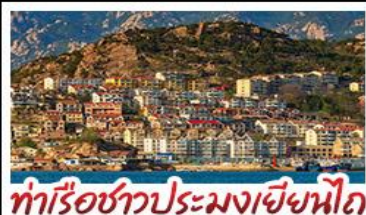
ทำเรือชาวประมงเยียนโก