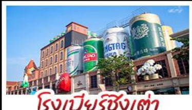
โรงเบียร์ชิงเต่า