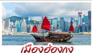
เมืองฮ่อทง