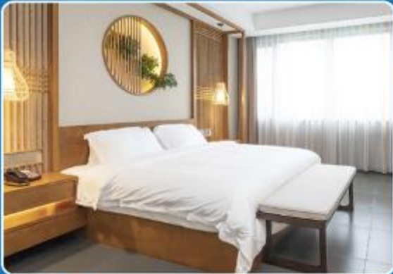
👤👤 DOUBLE (DBL)