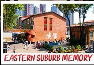
EASTERN SUBURB MEMORY