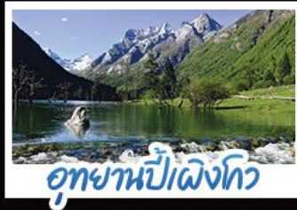
อุทยานปี่เผิงโกว

ภูเขาสัตรีณี อุกยานจิวจ้ายโกว นั่งรถไฟความเร็วสูง น้ำพุไม้ไฟตึกSKP อุทยานปี่เผิงโกว วัดต้าฉือ ถนนโบราณชอยกว้างชอยแคบ ช้อปปิ้งถนนไถ่กู่หลี่ + ถนนซุนซีลู่