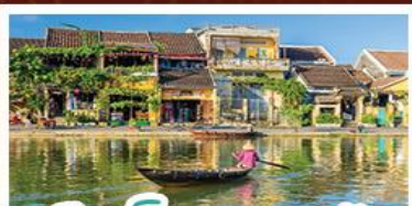
เมืองโบราณเฮอฮัน

! พักบนเขาน่าฮิลล์ 1 คืน ! สัมผัสอากาศเย็นตลอดปี สตรีตฟรังเศสสุดคลาสสิก - นั่งกระเช้ายาวที่สุด สู่มานาฮิลล์ สนุกสุดมันส์ไปกับสวนสนุก The Fantasy Park มีบริการเช่าแม่ทวนอิมองค์ใหญ่ที่สุดของเมืองดานัง - เช็กอินเมืองมรดกโลกฮอยอัน - สนุกสนานไปกับกิจกรรม!!นั่งเรือกระดิง หมู่บ้านกัมทาน เช็กอินร้านอาหาร SON TRA MARINA CAFE - ไม่ลงร้านช้อปปิ้ง - อิ่มอร่อยกับบุฟเฟ่ต์นานาชาติ , หม้อไฟซีฟู้ด