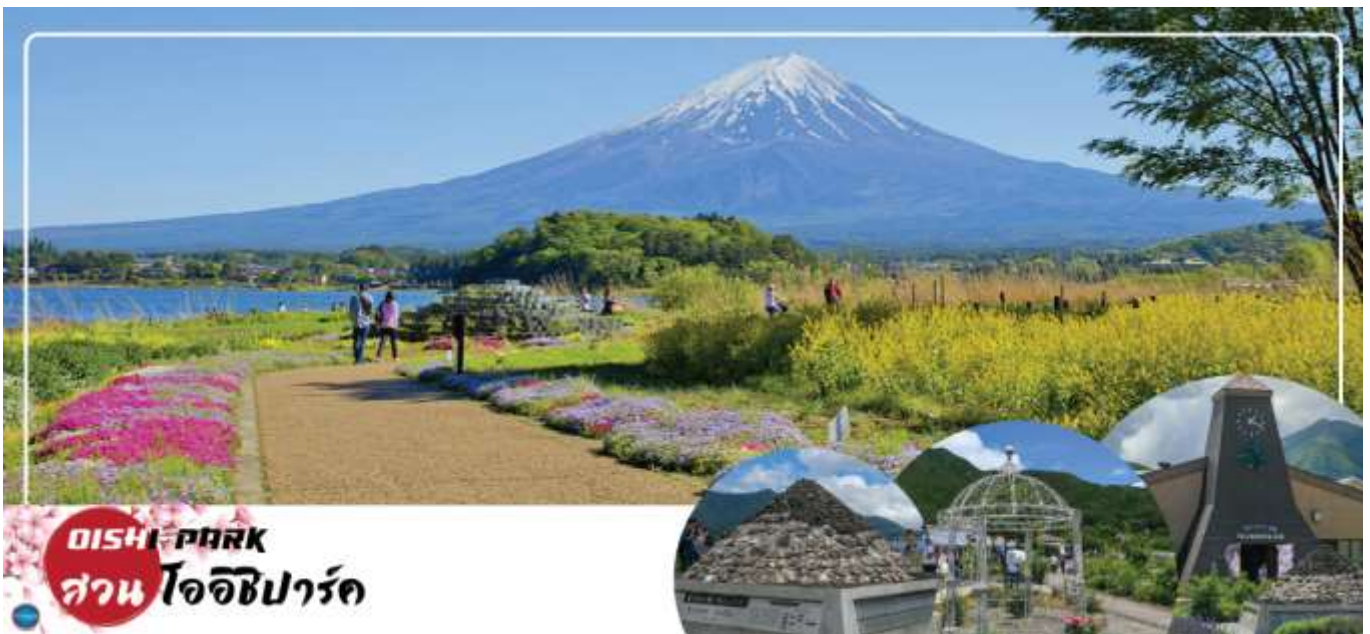
OISHI PARK สวน โออิชิพาร์ค

วันที่สาม จังหวัดยามานาชิ – สวนสาธารณะโออิชิ – พิพิธภัณฑ์ญี่ปุ่น – โกเทมบะพรีเมียมเอาท์เล็ต – เมืองนาริตะ – อีออน มอลล์ นาริตะ