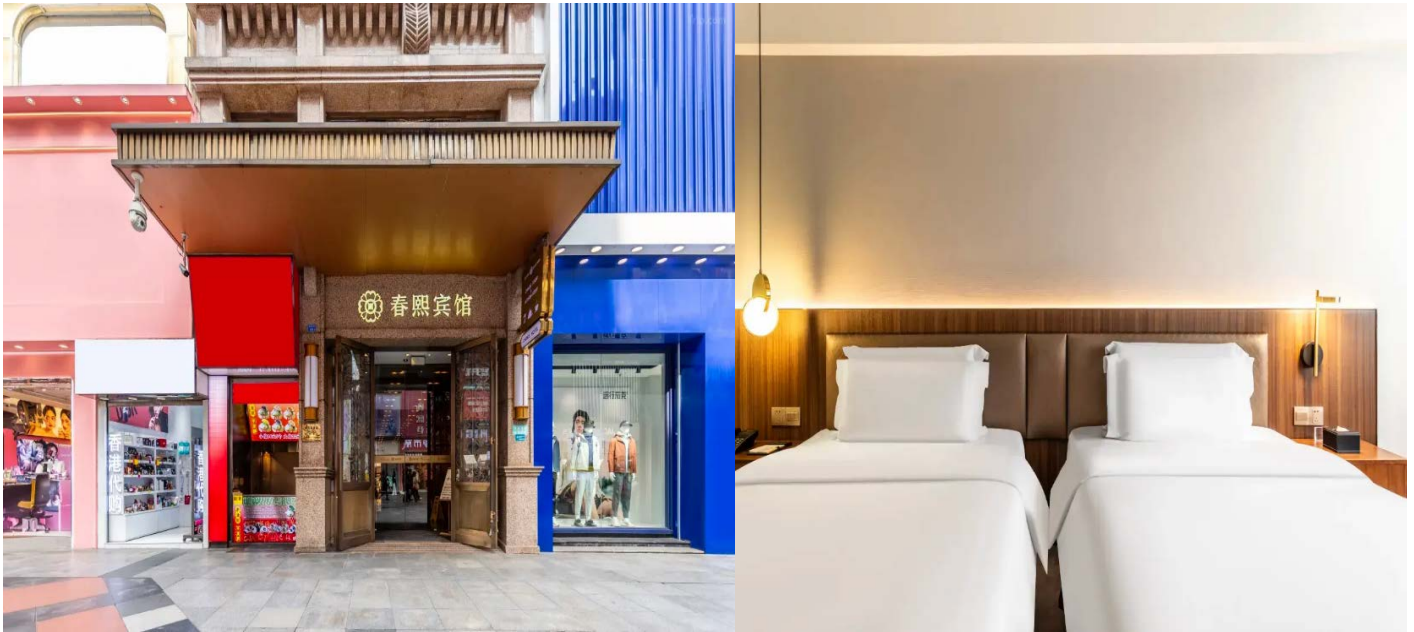
โรงแรมใจกลางย่านช้อปปิ้งชุนซีลู่

Cheangdu Chunxi Hotel ย่านช้อปปิ้งชุนซีลู่ หรือระดับเทียบเท่า พักห้องละ 2-3 ท่าน หมายเหตุ โรงแรมที่พัก จะแจ้งให้ท่านทราบ ก่อนเดินทางโดยประมาณ 5-7 วันทำการ