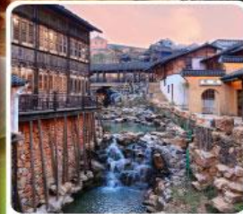
เมืองโบราณเหยahu