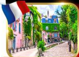
Rue de l'Abreuvoir มงมาร์ต