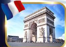
ประตูชัยอาร์กเดอทรียัมป์