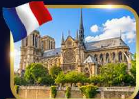
มหาวิหารนอทร์เดอรัว