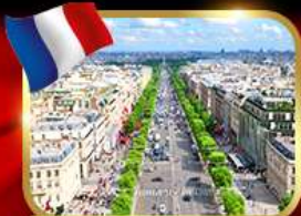
เดินเล่นย่านช็องเซลีซ