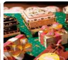
กล่องดนตรี MUSIC BOX