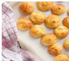
ร้าน KITAKARO ซึ่งเป็นขนมอบจากเตาสดๆ พิเศษๆ ให้ชื่อของร้านคือขนมที่ชื่อว่า และเพราะที่จะชื่อของร้านเป็นอย่างไร