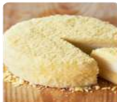
ร้าน LeTAO ร้านมีผลิตภัณฑ์ด้วย ด้วยบรรยากาศในร้านตกแต่งด้วยไม้ที่แสนอบอุ่น อีกทั้งด้วยด้วยบรรยากาศแบบป๊อปอาร์ต