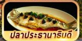
ปลาประรานาโรบิต